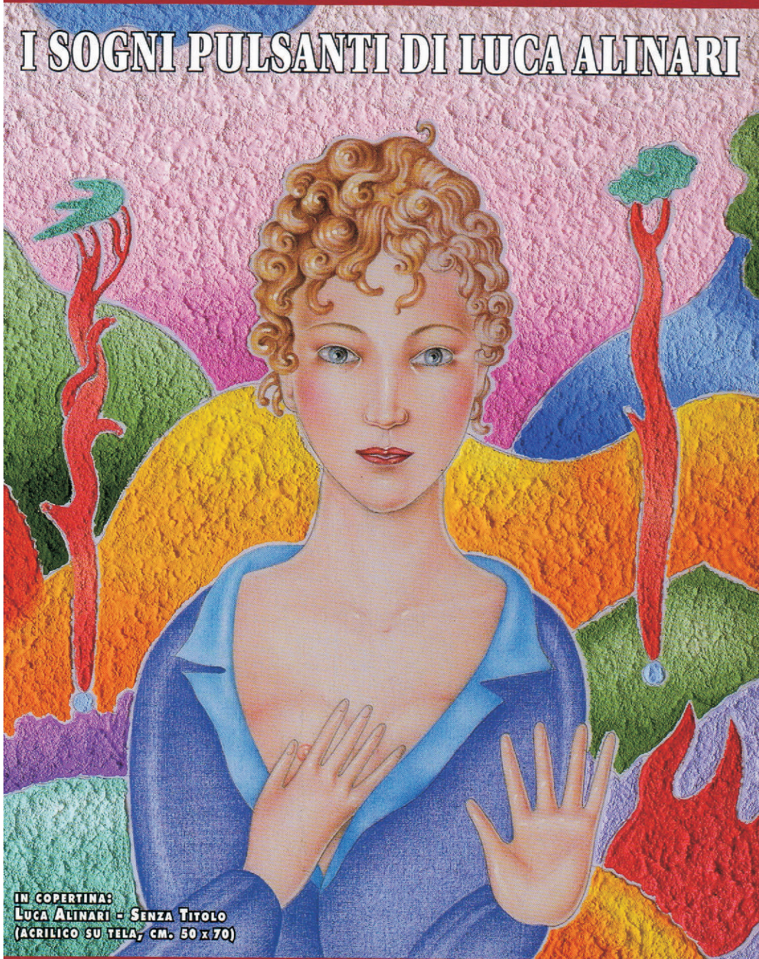
IN COPERTINA: LUCA ALINARI - SENZA TITOLO (ACRILICO SU TELA, CM. 50 x 70)